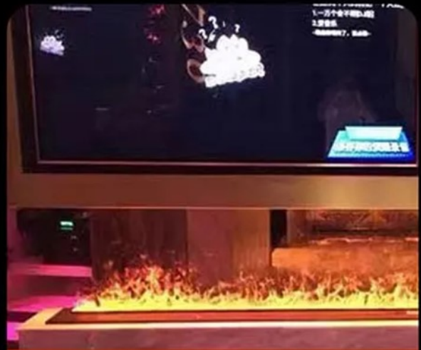
Bar Decoration Cases