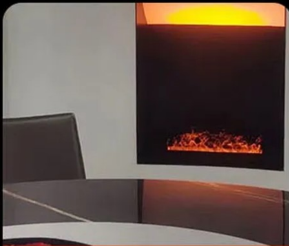
Restaurant Decoration Case