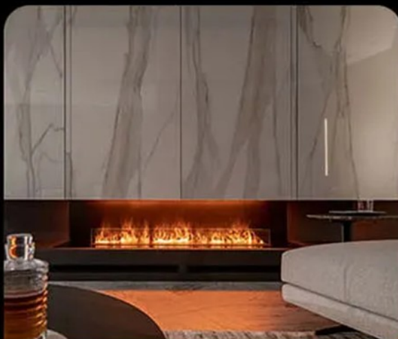
Office Decoration Cases