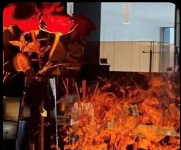
Hotel Decoration Cases