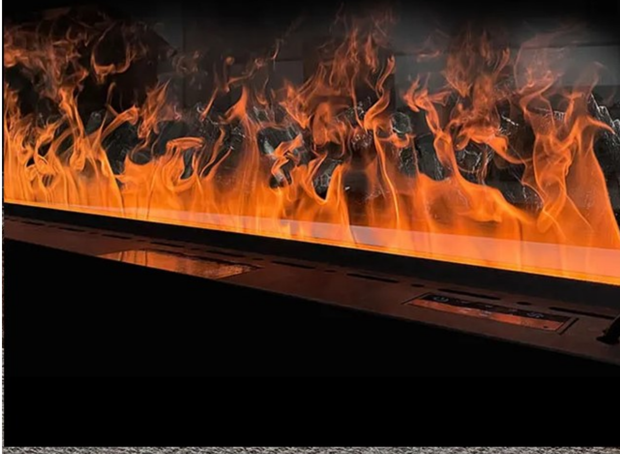
Трёхмерная симуляция пламени